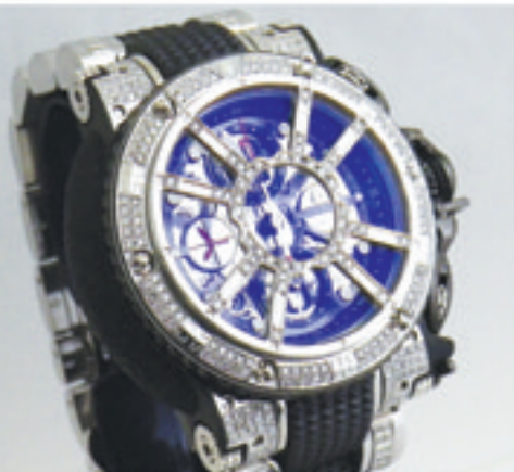
1. Aquaumatic King Sub Chrono

- GaGa milano Dia Series - 数字のダイヤカスタムも承ります