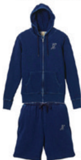
5. Denim Sweat Setup

Swarovski Order Made High Quality Order Swarovski Custom Made