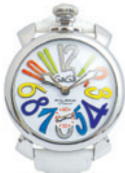
3. Manuale Dia Pave