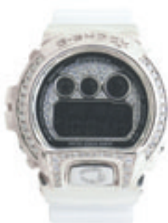
2. Double Line