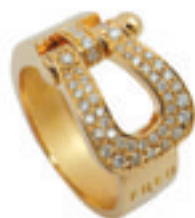
5.Fred Force 10 Ring Pave