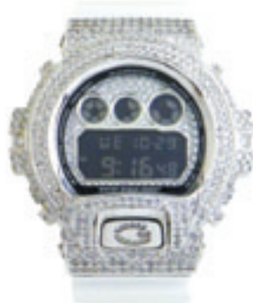
1. White Full Complete