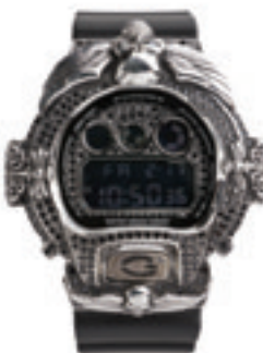
6. 69 Full Complete