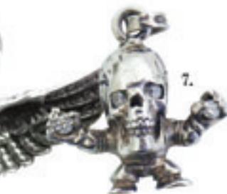
7.Foti Harristester Dia