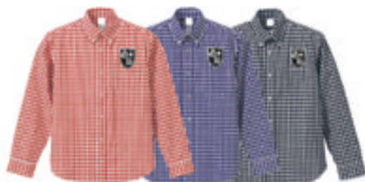
6. Check Shirts GB-Star Wappen

Swarovski Order Made High Quality Order Swarovski Custom Made