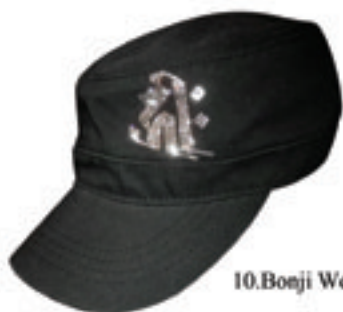
10.Bonji Work Cap