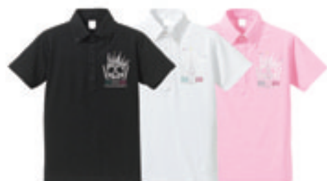
3. Crown Skull Polo Sw