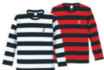
2. Border Shirts G Sw