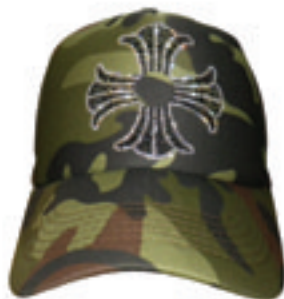
5.Double Cross Como