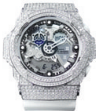
1.Full Complete 300