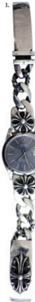
1.Chrome Hearts x Rolex