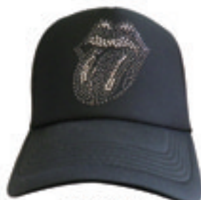
9.Lip & Tang