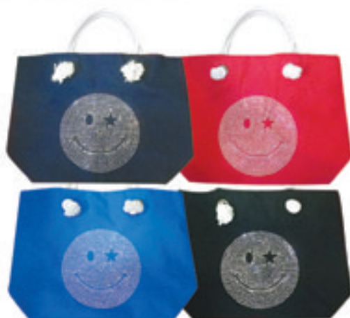
2.Niko Star Swarovski Canvas Bag