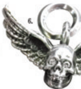
6.Foti Maharia Dia