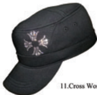
11.Cross Work Cap