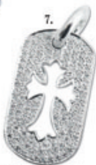
7.Cutout Cross Pave