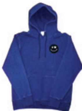
5.Niko Star Wappen Denim Sweat