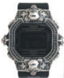
7. 56 Full Complete