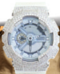
5.Full Complete 100