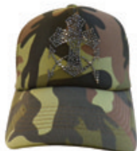
4.Cross Anchor Como