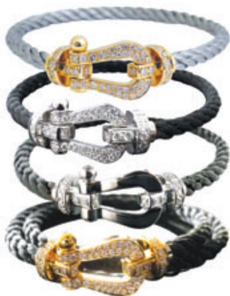
1.Fred Force 10 Bracelet Pink Gold Pave