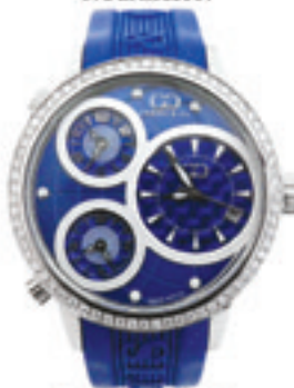
Big Time World