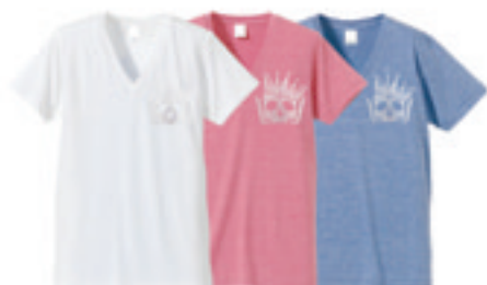
4. Crown Skull V Neck Sw