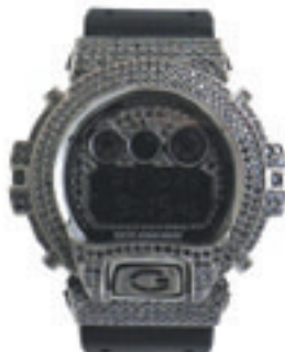
4. Black Full Complete