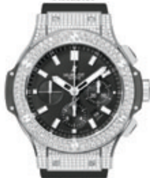
Big Bang Pave