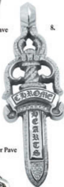
8.Large Dagger Pave