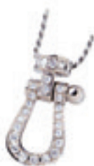
7.Fred Force 10 Necklace Pave