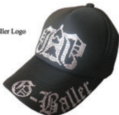
10.Lux G-Baller Logo

Swarovski Cap Order Made High Quality Order Swarovski Custom Made