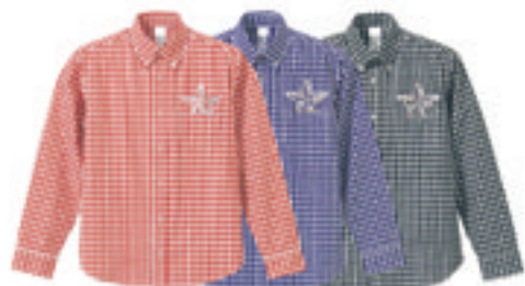
1. Check Shirts Star Sw