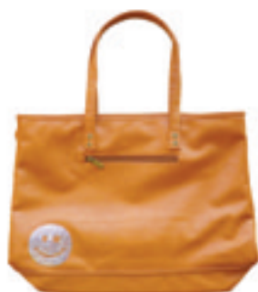
3.Niko Star Swarovski Leather Bag