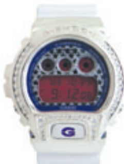
3. Double Line Star