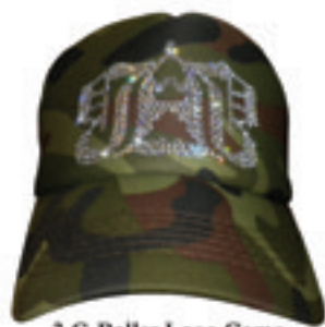
3.G-Baller Logo Como