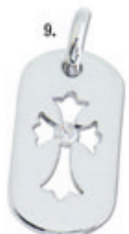
9.Cutout Cross Dia