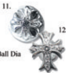
11.Cross Ball Dia