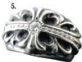
5.Floral Cross Pave