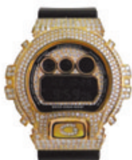
5. Pink Full Complete