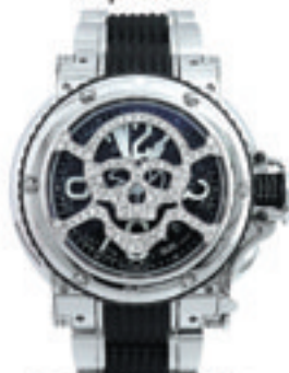
King Sub Commander