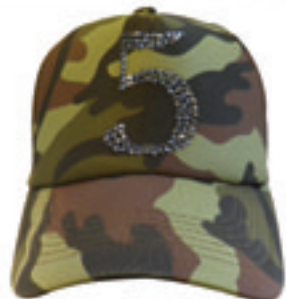
1.Number 5 Como