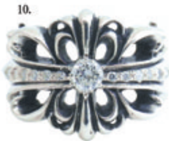
10.Double Floral Cross Pave