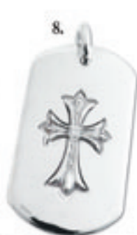
8.Tiny Cross Pave