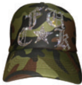
6.Fuck Star Como