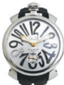
2. Index Dia Custom