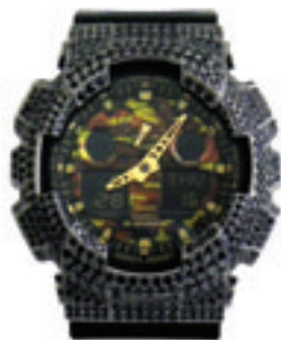
6.Como Custom 100