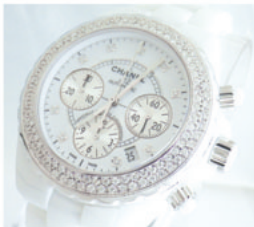
10. Chanel J12 41mm

腕時計販売から、アフターダイヤ加工・修理まで承っております。 ご希望の腕時計をお探して、ダイヤカスタムを施すことも可能です。