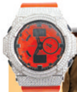
4.Full Complete 150