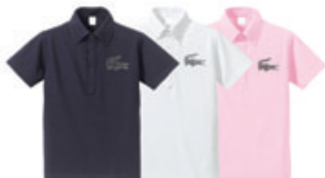
7. Big Laco Polo Sw Custom