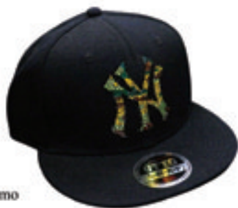
7.NY Logo Como