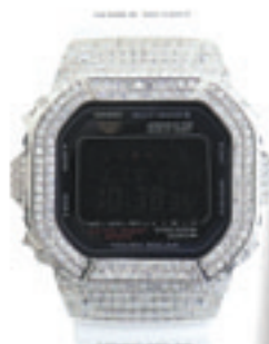
7.Solar Custom 56