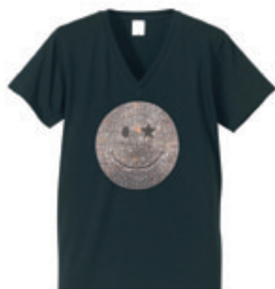
1.Niko Star Swarovski T-Shirts