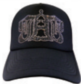
1.G-Baller Double Logo