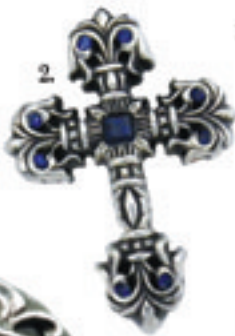
2.Filigree Cross Sapphire