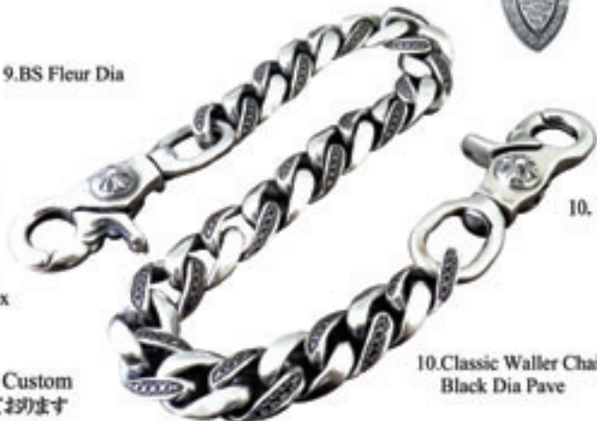
10.Classic Waller Chain Black Dia Pave

Diamond / Sapphire / Ruby etc... Custom 限定・レアアイテムも数多く取り扱っております