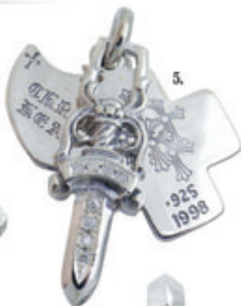
5.Three Trinkets Pave