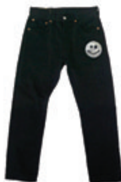
4.Niko Star Swarovski Denim